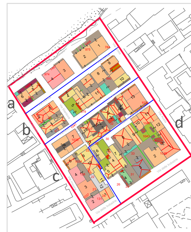
TAV. 10.b Analisi e verifica della Consistenza dei Comparti Comparto 4 isolato b

PISU- POR CALABRIA FESR 2007/2013- ASSE VIII Linea d'Intervento 8.1.2.1.