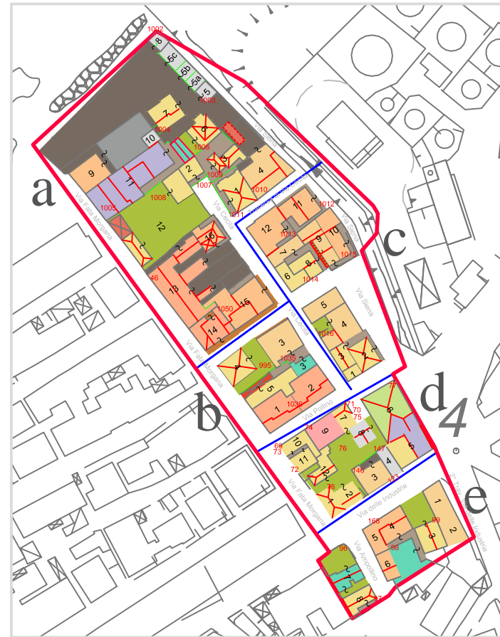
TAV. 14.d Analisi e verifica della Consistenza dei Comparti Comparto 8 isolato d

PISU- POR CALABRIA FESR 2007/2013- ASSE VIII Linea d'intervento 8.1.2.1.